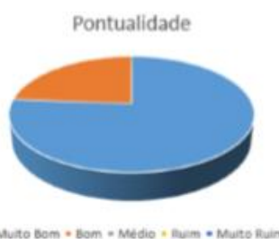
Figura (b): resultado referente à pontualidade da atividade.