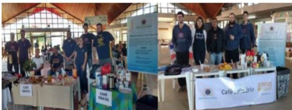
Figura 1: Café solidário realizado nos dias 14 de março (à esquerda) e 15 de agosto (à direita).