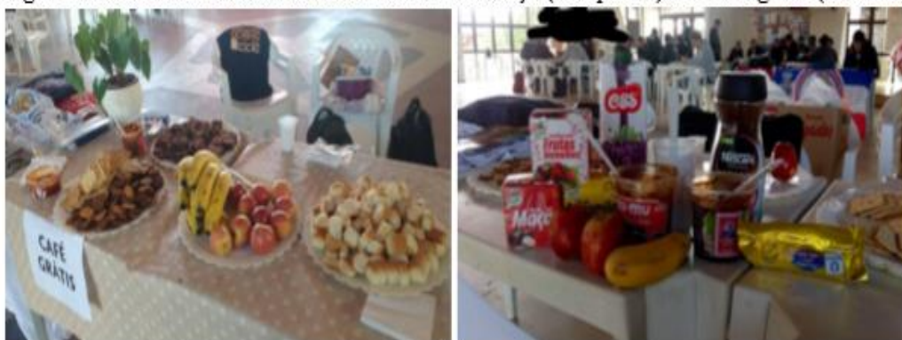
Figura 2: Café solidário realizado nos dias 14 de março (à esquerda) e 15 de agosto (à direita).