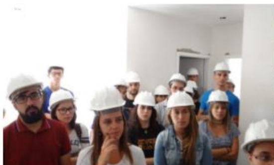
Figura 5 – Estudantes conhecendo as Técnicas Construtivas utilizadas na Obra

Serviço de Assistência à Construção Civil – SAsCC / EE / FURG