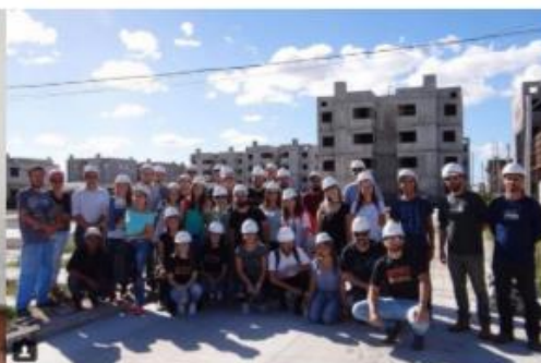
Figura 6 – Participantes e Organizadores no Canteiro de Obras