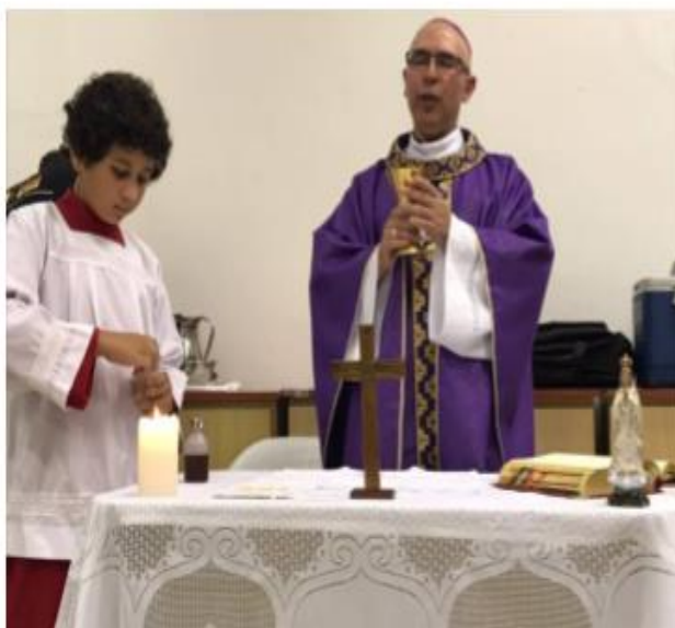
Figura 3: Santa Missa celebrada pelo Bispo da Diocese de Rio Grande Dom Ricardo Hoepers no Espaço Ecumenico do Centro de Convivências da FURG no dia 14 de março.