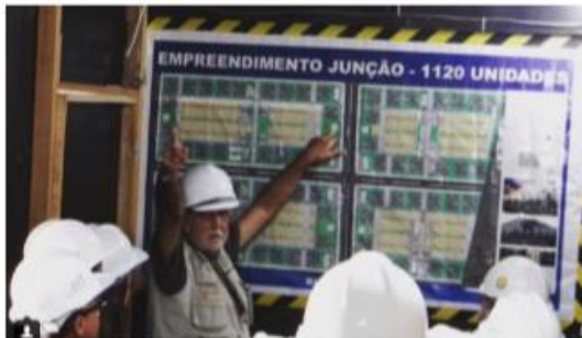
Figura 3 – Participantes em Contato com Engenheiros e Gestores da Obra

Na segunda atividade, realizou-se “Visita Técnica na Obra do Empreendimento Habitacional Junção”, conforme mostram as figuras 3, 4, 5 e 6.