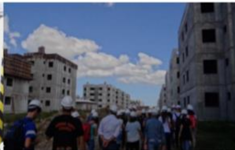
Figura 4 – Visitação nas Edificações do Empreendimento Junção