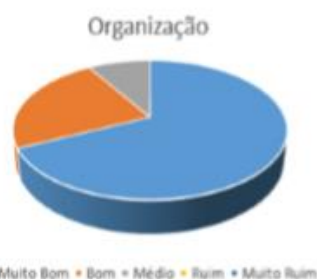
Figura (a): resultado referente à organização da atividade.

Os resultados dessa pesquisa permite verificar que as expectativas propostas pelo grupo foram alcançadas, como mostrado nas figuras (a),(b),(c) e (d).