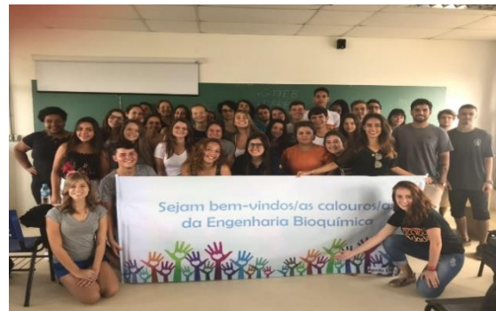
Figura 1 – (Esq.) Recepção dos calouros no período de matrículas e (dir.) 1º dia de atividades da Semana de Acolhida da Engenharia Bioquímica