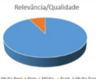
Figura (d): resultado referente à relevância/qualidade da atividade.

De tal maneira, torna-se visível a integração dos novos estudantes com a universidade, contribuindo assim para a formação de um ambiente acolhedor. Crê-se na importância da SZ uma vez que esta segue a filosofia petiana, que tem como um dos alicerces a formação de acadêmicos cada vez mais cidadãos e cientes da sua responsabilidade social (Moura CASTRO, 1979). Além disso, tal atividade é fundamental pois segue recomendações da Portaria de nº976 (MEC,s.d.), ao desenvolver atividades acadêmicas com padrões de qualidade de excelência, mediante grupos de aprendizagem tutorial de natureza coletiva e interdisciplinar;