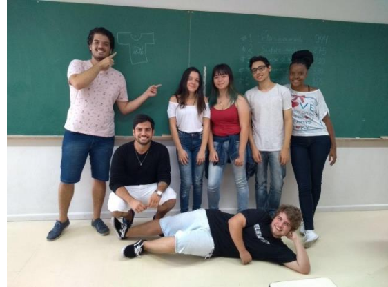
Figura 3 – Premiações das equipes vencedoras