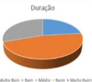
Figura (c): resultado referente à duração da atividade.